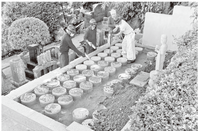
最終段階の骨壺納骨筒の永久固定仕上げ作業(横浜慶珊寺樹木葬墓地)

基本構造は上図のとおり、一般的な(特殊形状を除く)骨壺二つが上下にすっぽり収まる筒型のカロー卜が土中に埋設されているが、同社独自の技術・工法により土圧や水圧、浸水等の影響を最小限に抑えることで、カロー卜の耐久性や永続性が強化されている(特許申請中)特願