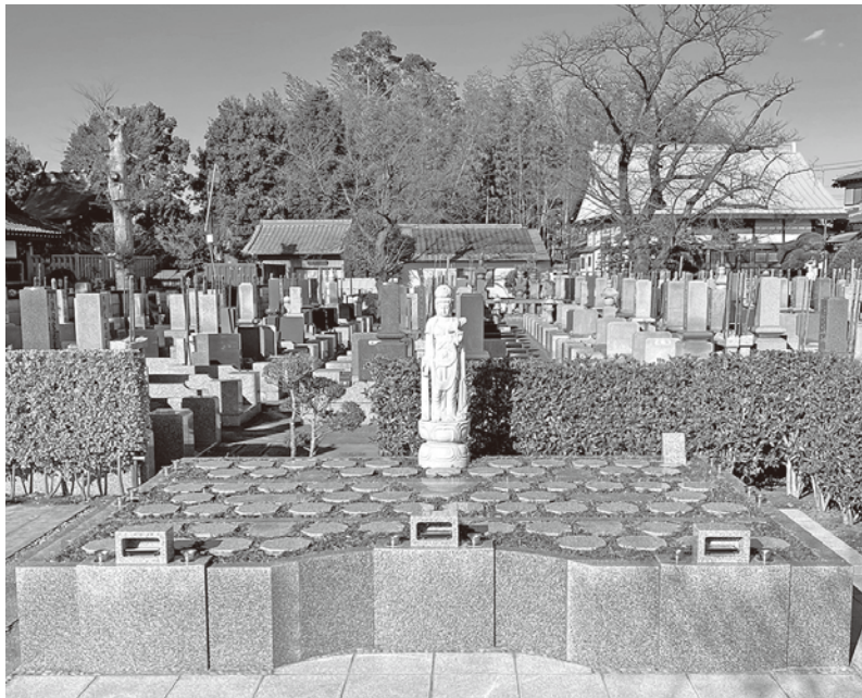
昨年12月に開設した野田樹木葬墓地「大地」（千葉県野田市、真光寺）。骨壺納骨型としては2例目となる