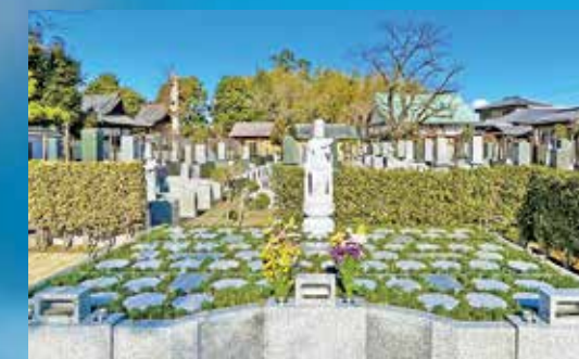
野田樹木葬墓地「大地」 骨壺納骨型