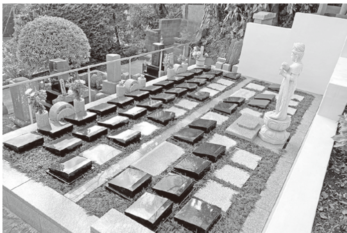
斜め上から見た横浜慶珊寺樹木葬墓地

「ご焼骨は、参列者全員が祈りを込めて骨壺に納めると『ご尊骨』になる、といわれています。その大事なご尊骨を、業者側の都合あるいは構造的な理由で別の容器に移し替えたり、粉骨することに少なからず抵抗感を感じる方もいらっしゃるでしょう。そこで当社では、亡